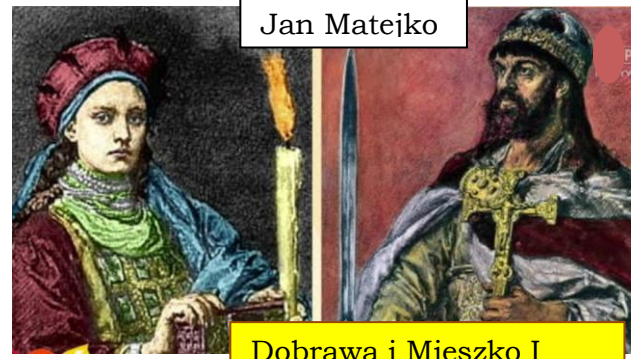
Dobrawa i Mieszko I