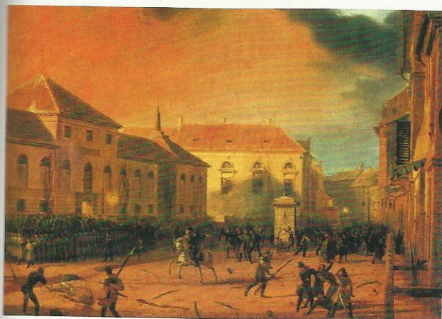
Zdobycie Arsenалу należało do przełomowych momentów nocy listopadowej. Powstańcy zdobyli kilkadziesiąt tysięcy karabinów, którymi posłużyli się, aby wyprzeć Rosjan ze stolicy. Scena przedstawiona została na obrazie Marcina Zaleskiego.

Łamanie konstytucji przez cara oraz walka z patriotycznymi organizacjami wywołały wśród Polaków wzrost nastrojów antyrosyjskich. Latem 1830 r. do Warszawy dotarła wiadomość o zwycięstwie rewolucji lipcowej w Paryżu. Wkrótce za pośrednictwem prasy zaczęto rozpowszechniać informacje o zamiarach wysłania przez cara armii Królestwa Polskiego do stłumienia powstania w Belgii. Spotkało się to z gwałtownym sprzeciwem żołnierzy i oficerów. Dopiero później okazało się, że plany cara nie były jeszcze przesądzone. W tym samym czasie pojawiła się także groźba wykrycia spisku przygotowywanego przez Piotra Wysockiego w Szkole Podchorążych Piechoty. Dlatego mimo zbliżającej się zimy spiskowcy podjęli decyzję o wybuchu powstania. Nie mieli oni dokładnego planu działania ani nie wyłonili przywódcy zrywu. Zgodnie z romantycznymi wyobrażeniami wierzyli, że gdy rozpoczną walkę, spontanicznie przyłączy się do nich całe społeczeństwo.