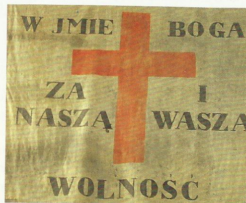
Sztandar z napisem W imię Boga, za naszą i waszą wolność to jedna z najcenniejszych pamiątek z okresu powstania listopadowego.

Do najważniejszych haseł polskich powstańców w XIX w. należały słowa: Za wolność waszą i naszą . Po raz pierwszy w nieco innej formie znalazły się one na sztandarze niesionym podczas warszawskiej manifestacji ku czci dekabrystów w styczniu 1831 r. Hasło to, zapisane w języku polskim i rosyjskim, miało pokazać, że powstańcy toczą walkę z carskim despotyzmem, a nie z Rosjanami.