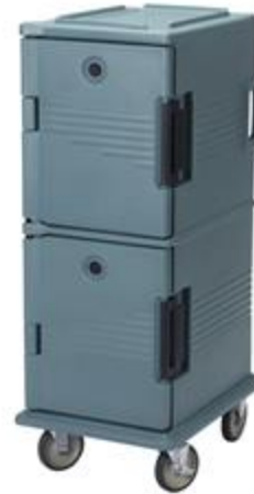
Hot box for food